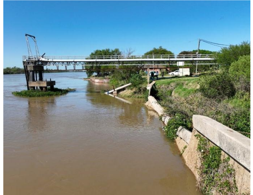
2023 - Estado del sector previo a la obra de reparación de las defensas