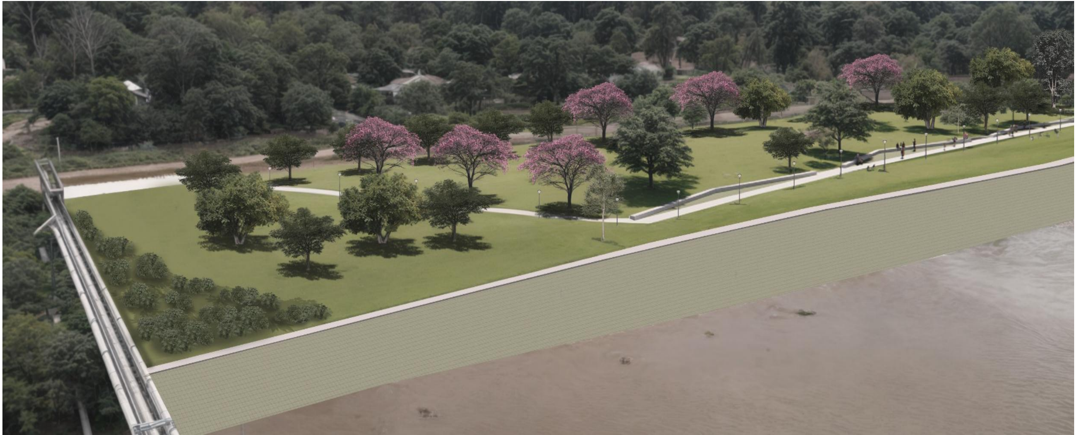
IMAGEN DEL PROYECTO