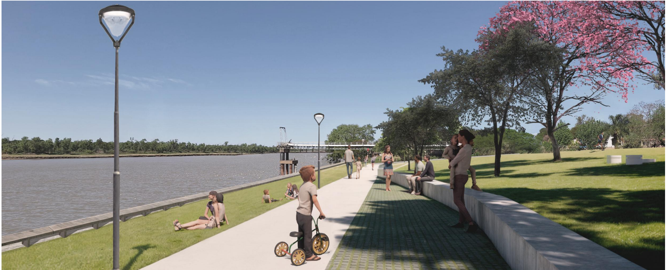
IMAGEN DEL PROYECTO