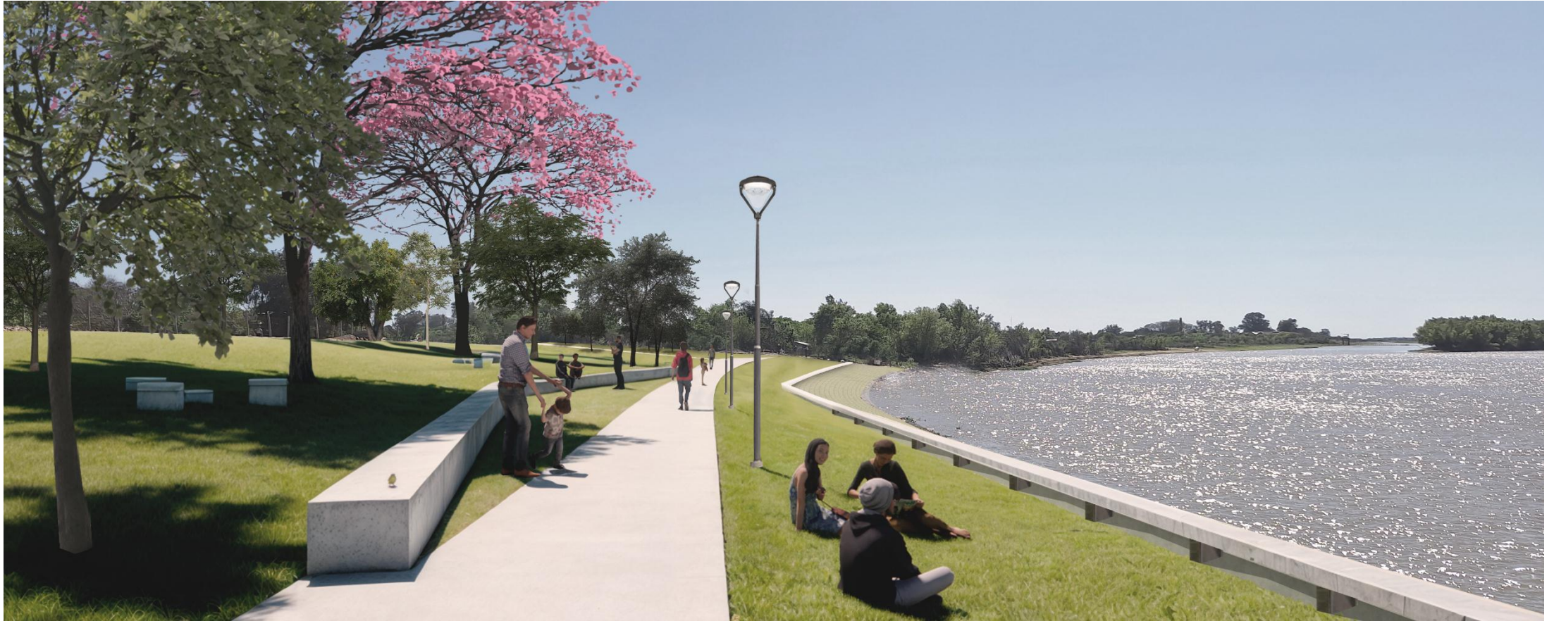
IMAGEN DEL PROYECTO