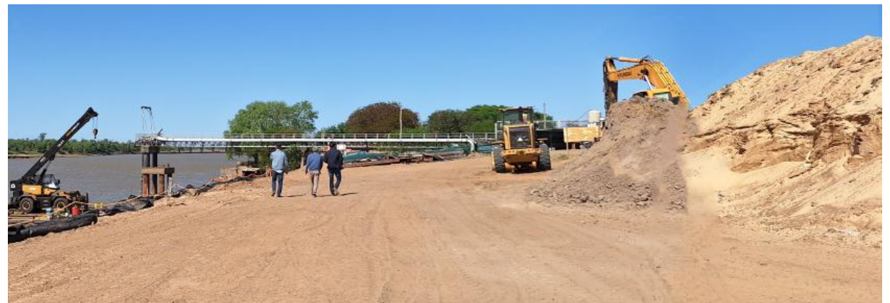
2024 - Estado actual de la obra de reparación de las defensas